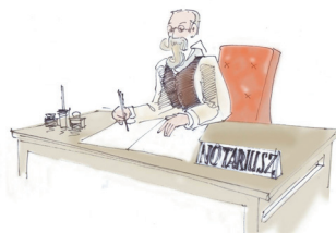
- Uchwały Walnego Zgromadzenia Akcjonariuszy sporządza notariusz.

Zasadniczą część protokołu stanowią uchwały podjęte na walnym zgromadzeniu oraz głosy oddane za każdą z nich. Poza tym protokół powinien wymienić sprzeciwy zgłoszone przez akcjonariuszy. Zgłoszenie sprzeciwu do protokołu jest jedną z przesłanek późniejszego zażądania uchylenia uchwały.