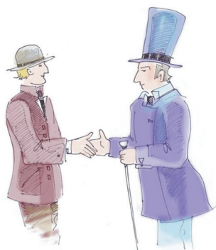
- Sąd polubowny rozstrzygnął spór.

Istota sądownictwa polubownego polega na tym, że strony zamiast wnosić powództwo do