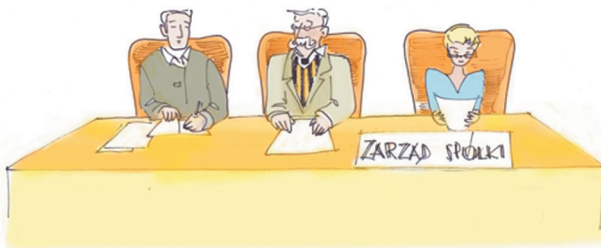
- Zwołujemy Walne Zgromadzenie Akcjonariuszy.

Statut spółki może przyznać powyższe uprawnienie rady nadzorczej także innym osobom np. akcjonariuszom reprezentującym odpowiednią część kapitału zakładowego spółki .