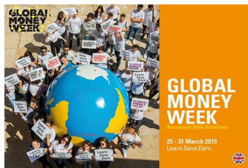
GMW Branding & Style Guidelines