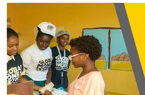
GMW Post-Form 2019

| Wszystkie materiały pomocnicze są dostępne online w sekcji 'Resources' na www.globalmoneyweek.org