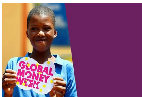
GMW Print Pack: Printable Promotional Resources