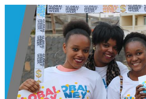
GMW Pre-Form 2019