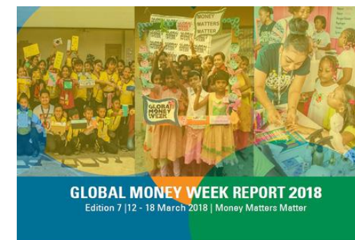
GMW Reports 2013 - 2018