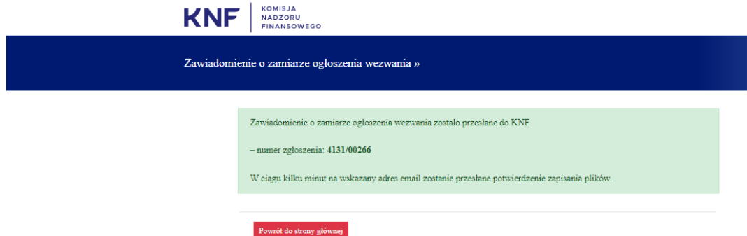
Rysunek 5. Komunikat po prawidłowo zakończonym wypełnieniu formularza

WAŻNE!!!: to nie jest potwierdzenie, że zawiadomienie o zamiarze ogłoszenia wezwania zostało przekazane do KNF. Potwierdzeniem przekazania formularza wraz załącznikami jest wiadomość email (Rysunek 6).